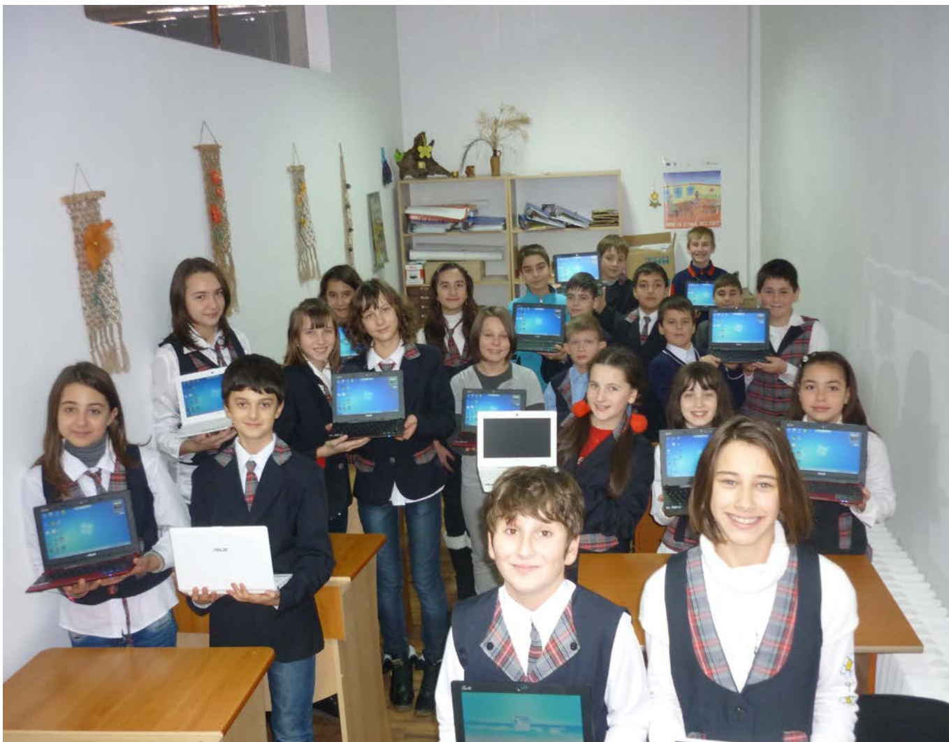
Calculatoare câștigate de elevii Școlii Nr.5 la concursul “Profi te premiază” 2012.